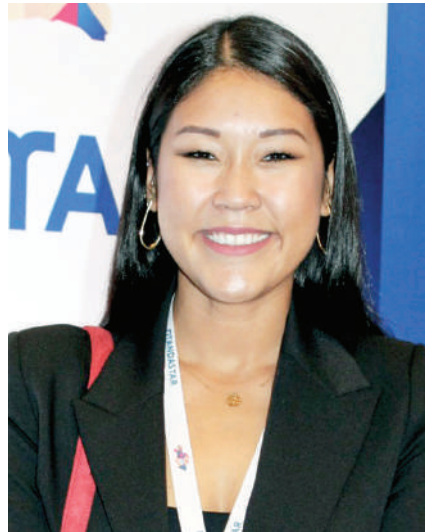
Иешим САВАШ, Крей қаласы әкімінің орынбасары (Франция):